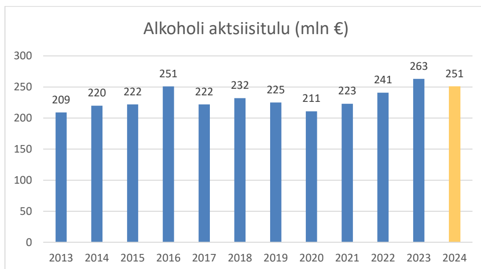
Joonis 2. Alkoholi aktsiisitulu aastatel 2013–2023 ja 2024. a prognoos.

Pärast kange alkoholi, õlle ja siidri aktsiisimäära vähendamist 25% 2019. aasta juulis tõsteti esmakordselt aktsiisi 2024. aastal. Arvestades piirikaubanduse riski otsustati aktsiisitulude kasvu eesmärgil tõsta aktsiisi vähehaaval, see on 5% aastas. Käesoleva aasta 6 kuu aktsiisitulude andmete alusel on alust eeldada, et aktsiisitulu ei kasva loodetud ulatuses. Ettevõtjad soetasid aktsiisitõusueelseid varusid optimistlikumalt kui oleks olnud otstarbekas. Neid varusid (alkohol 2023. a aktsiisiga) realiseeritakse veel käesolev ajal, see on suvel. Ettevõtjad eeldasid muuhulgas turistide arvukuse suurenemist, kuid olukord kujunes tagasihoidlikumaks. 2024. aasta 6 kuu laekumine alkoholiaktsiisist on 16% madalam möödunud aasta samast perioodist. Vastavalt 2024. aasta suveprognosile laekub alkoholiaktsiisi 240 mln eurot, mis on 11 mln vähem algselt prognoositud.